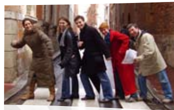
L'Étrange Rallye Toulousain