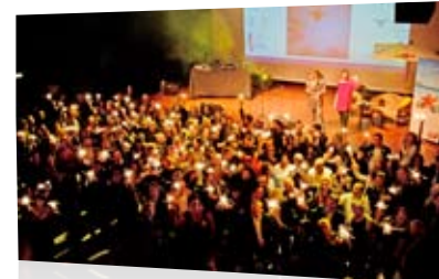
Fête des 200 Adhérents au Bikini