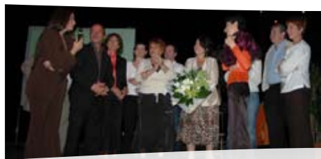
25 ans du Club de la Communication au Stadium