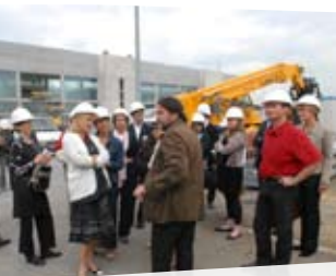
Visite du chantier du Hall D de l'Aéroport Toulouse-Montaudou